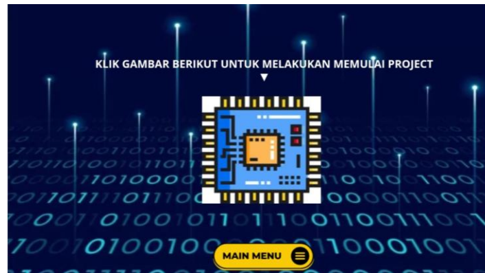
Gambar 6. Tampilan project