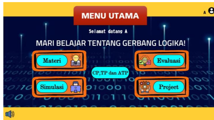
Gambar 2. Tampilan menu utama

pembelajaran yang membantu siswa untuk belajar secara terstruktur dan interaktif. Tampilan menu utama dapat dilihat pada Gambar 2 .