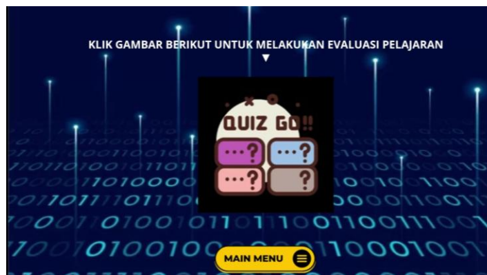
Gambar 7. Tampilan evaluasi

Evaluasi merupakan sarana penting untuk mengukur pemahaman peserta didik terhadap materi yang telah disampaikan serta menilai keberhasilan tercapainya tujuan pembelajaran. Pada media pembelajaran ini, evaluasi disajikan dalam bentuk soal pilihan ganda dan true or false . Soal-soal tersebut dirancang berdasarkan materi yang terdapat dalam media pembelajaran, sehingga mampu menguji berbagai aspek pemahaman siswa secara komprehensif. Evaluasi ini berperan sebagai alat untuk mengonfirmasi sejauh mana peserta didik telah menguasai konsep-konsep utama yang dipelajari, dan juga sebagai umpan balik bagi guru untuk mengetahui apakah tujuan pembelajaran sudah tercapai. Tampilan evaluasi dapat dilihat dari Gambar 7.