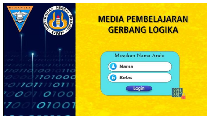
Gambar 1. Tampilan cover

Bagian awal yang memuat judul media pembelajaran, logo Universitas Negeri Padang (UNP), dan logo Himpunan Mahasiswa Teknik Elektronika (Himanika). Di bagian ini juga terdapat halaman login yang meminta peserta didik mengisi nama dan kelas mereka, sehingga dapat menarik minat peserta didik untuk mempelajari isi media. Tampilan cover dapat dilihat pada Gambar 1 .