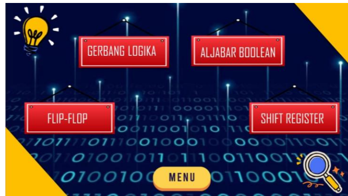
Gambar 4. Tampilan menu materi